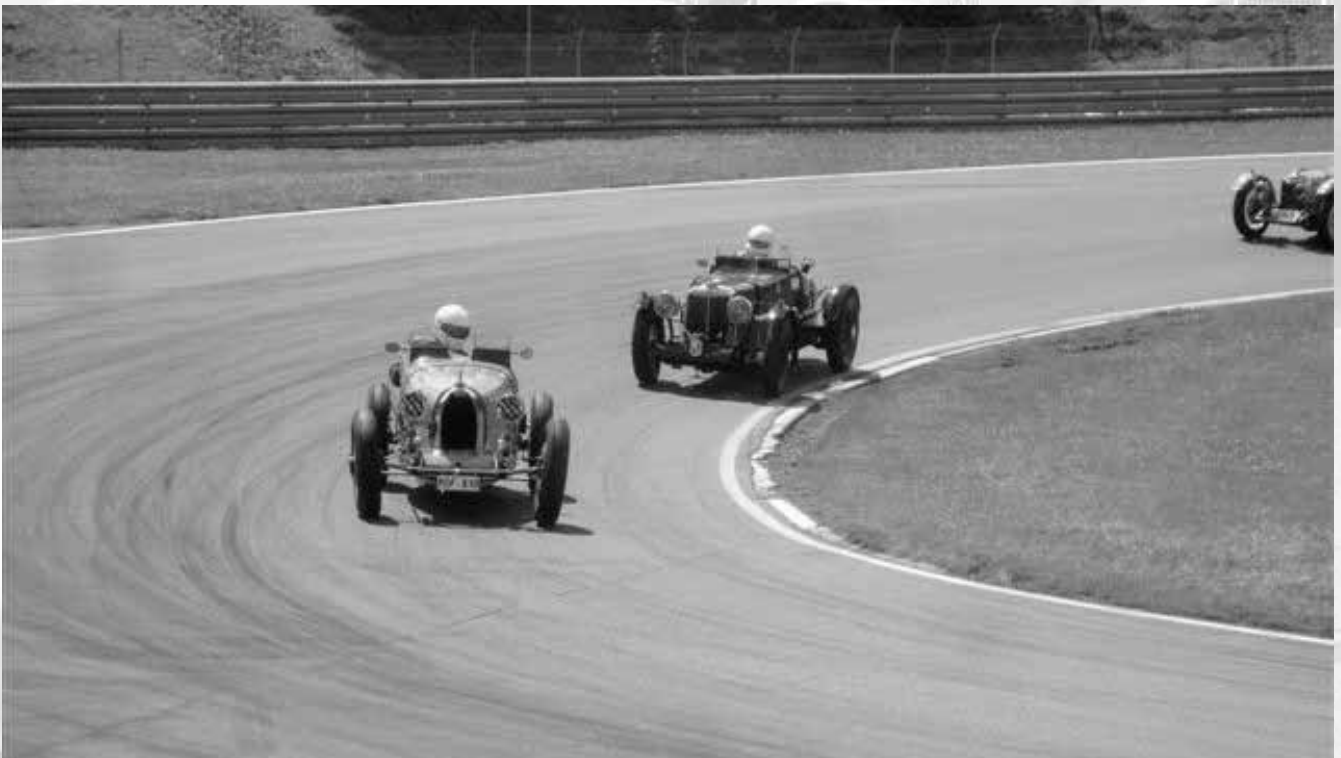
Per-Olof Håkansson i Bugatti typ 51 1935 jagas av Chappie Bird i MG K3 1934.