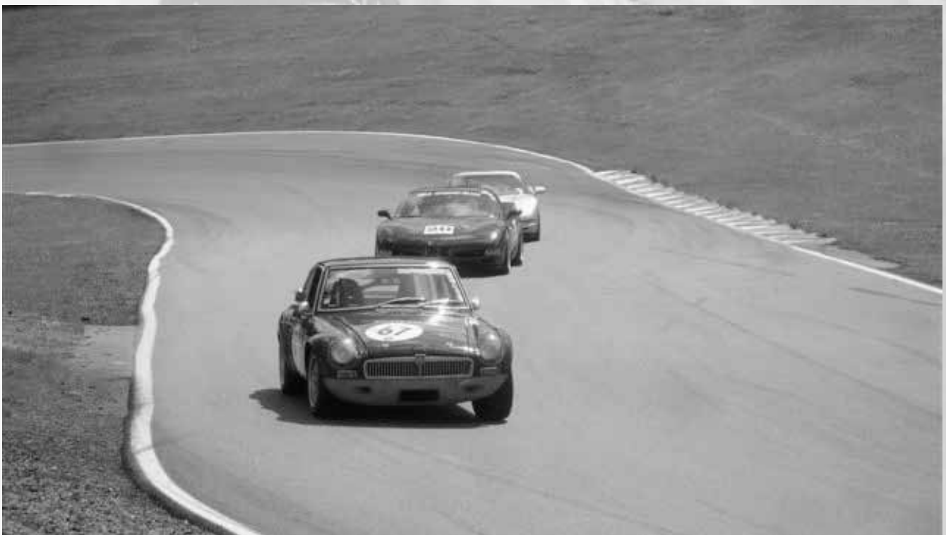
Lopp 5 Roadsport A och B Rolf Dawidzon i MGB GT jagas av två Corvette C5