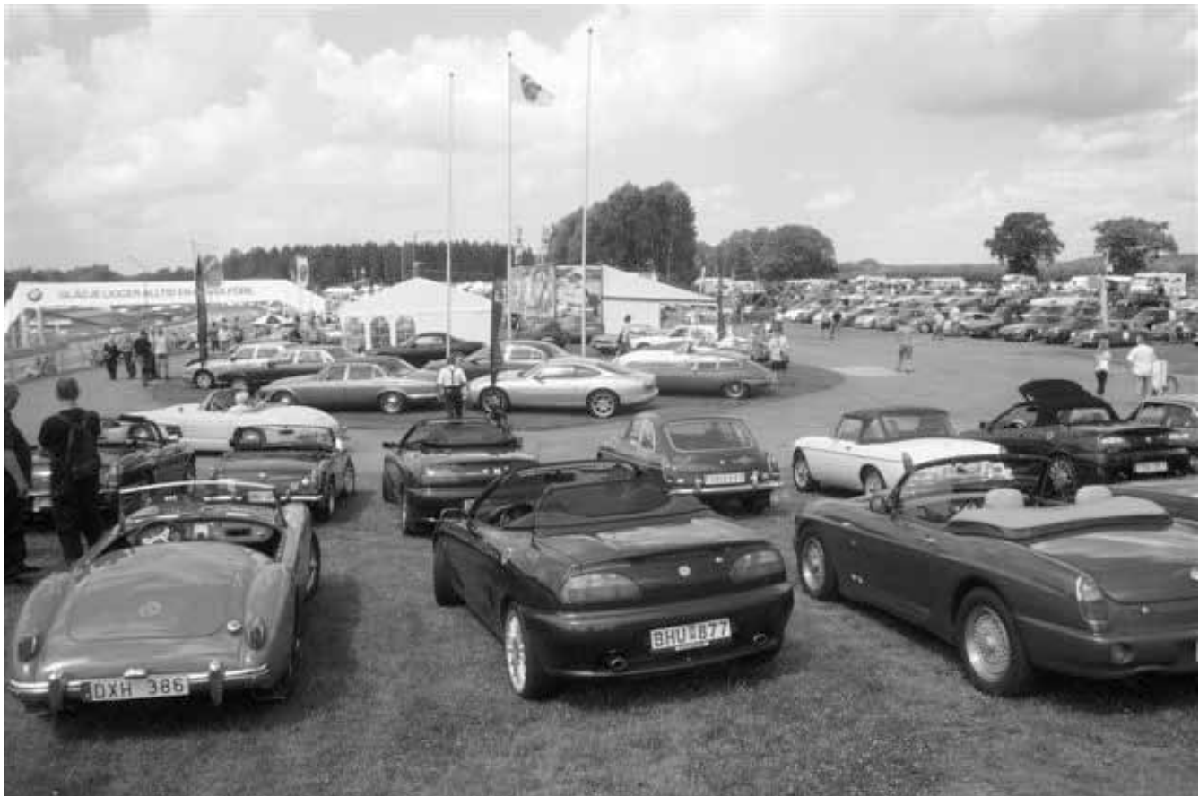
Delar av sportbilspareringen.