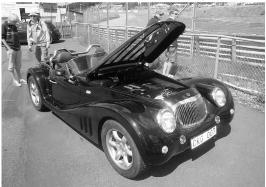
En sällsynt Leopard som öppnat gapet. En av 3 startbilar under söndagen.